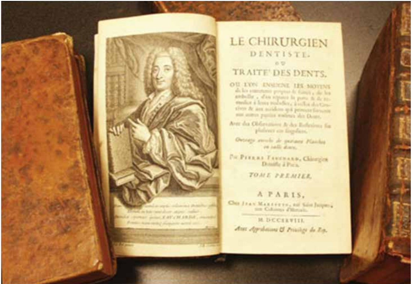
Pierre Fauchard's Le Chirurgien Dentiste , 1ra ed., 1728.

Biblioteca Waldmann. Escuela de Odontología. Universidad de Nueva York, Estados Unidos.